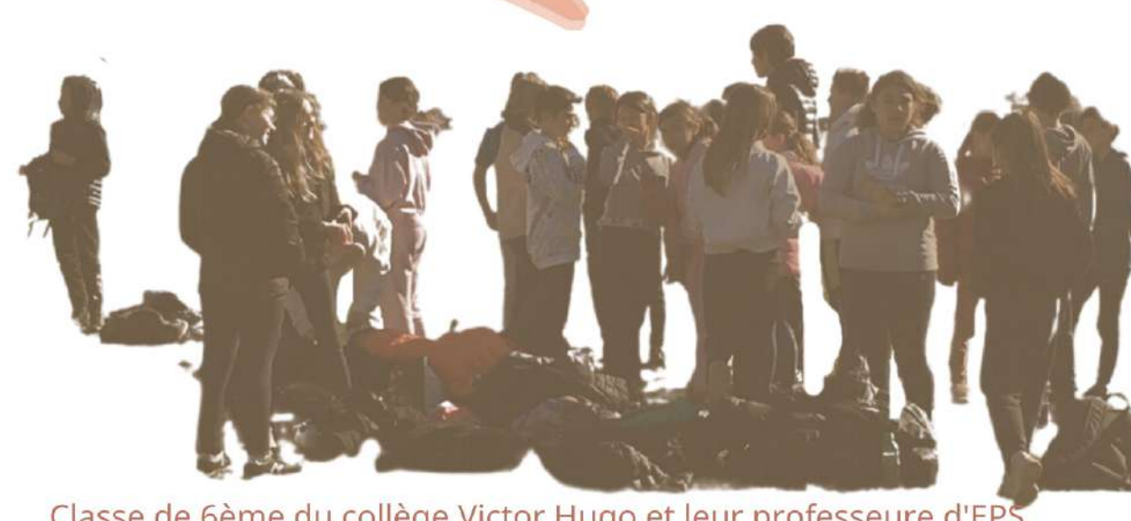
Classe de 6ème du collège Victor Hugo et leur professeur d'EPS.

"Au collège, le terrain de football n'est pas trop utilisé comme tel, on fait du demi-fond dessus ou d'autres activités. On s'en sert plus comme une zone enherbée. C'est dommage qu'il n'y ait pas 2 points d'eau et qu'une seule toilette."